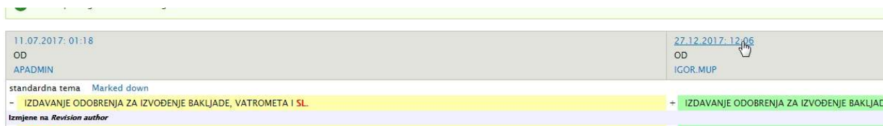
Slika 4. Pristup preko datuma

Klikom na naziv postupka pristupa se pregledu verzija u kome se vidi ko je kada uređivao koju verziju. Klikom na dugme “Usporedi” vide se razlike između verzija. Nakon pregleda razlika, ukoliko je zahtjev za promjenom prihvaćen, klikom na datum unosa verzije, pristupa se pregledom postupka sa mogućnošću objavljivanja.